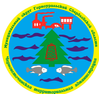
Черноисточинская территориальная администрация п. Черноисточинск (300 лет)