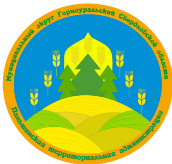
Паньшинская территориальная администрация с. Кондрашина (275 лет)