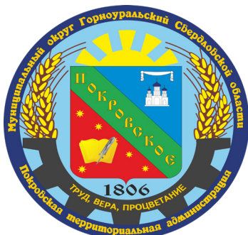
Покровская территориальная администрация с. Покровское (220 лет)